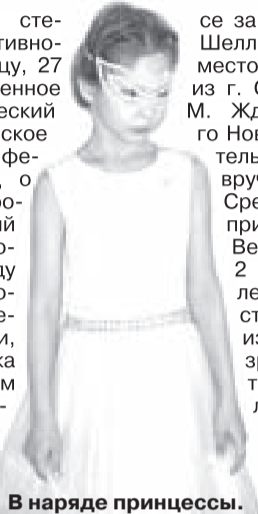
В наряде принцессы.

В этот же день состоялось торжественное закрытие фестиваля. И на него обычно собирается большое количество зрителей.