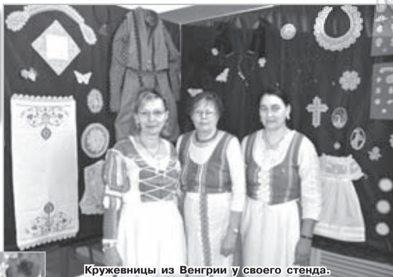
Кружевницы из Венгрии у своего стенда.

С полным правом можно назвать многие представленные на выставке изделия настоящими произведениями искусства. Салфетки и скатерти, шали и пояса, обереги, подвески, колье, браслеты, серьги и другие разнообразные украшения, всё это выполнено вручную, благодаря кропотливому труду кружевниц, их невероятному терпению и фантазии.