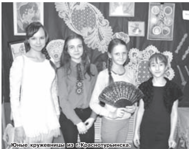
Юные кружевницы из г.Красноурьянска.