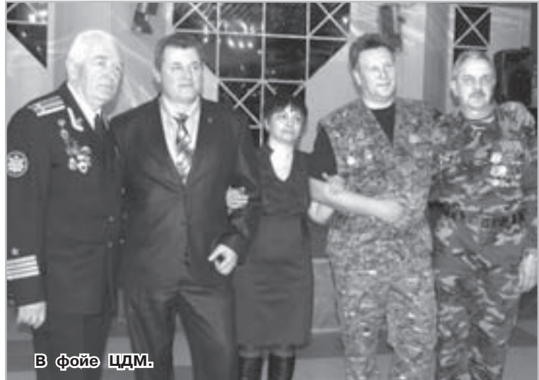
В фойе ЦДМ.