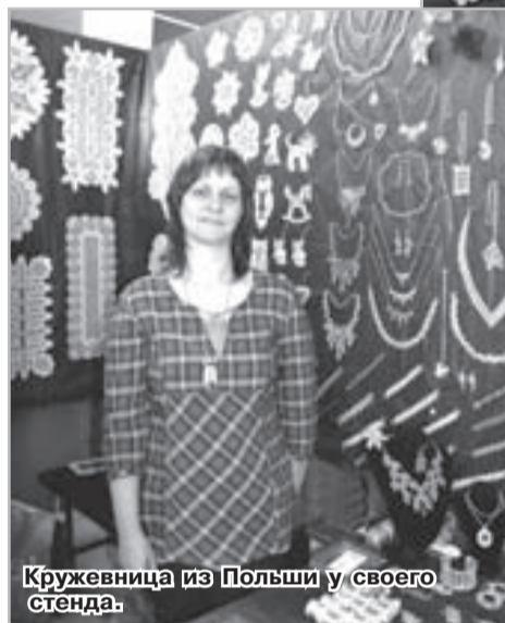
Кружевница из Польши у своего стенда.

Вот и на этот раз оно привлекло много радужных любителей рукоделия.